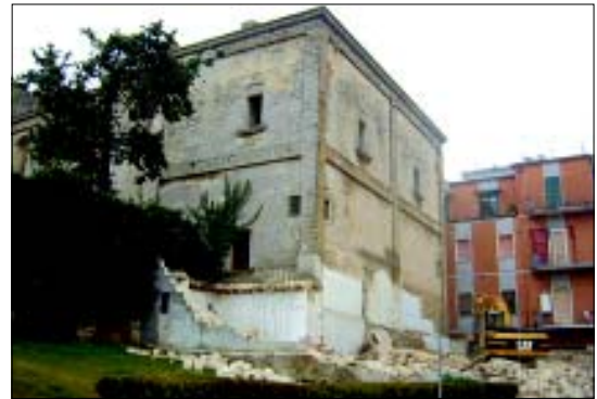
Sopra, nella foto, l'Amministrazione comunale ha proceduto al recupero di un'area urbana in via Manfredi Svevo. Per valorizzare il retro della Chiesa di S. Anna ha fatto abbattere una abitazione acquistata dagli eredi Magri .

le l'erogazione di tale contributo, per una durata massima di 12 mesi, a persone disabili e anziani, in condizioni di non autosufficienza grave che vivono da soli e ai nuclei familiari in cui vivano continuamente, una o più persone non autosufficienti. La ratio dell'intervento fatto proprio dall'Ambito Territoriale n. 4 è quello di ridurre l'incidenza che i vincoli economici e il disagio derivante da insufficienza reddito possono esercitare sulla scelta e sulla capacità di un nucleo familiare di prendersi cura, per la parte di competenza, di una persona in condizione di fragilità derivante da non autosufficienza. Obiettivo prioritario è prolungare la permanenza del soggetto non autosufficiente nel proprio contesto di vita familiare e sociale, riducendo il ricorso alle prestazioni residenziali e semiresidenziali, quando le condizioni di salute e il contesto abitativo lo consentono". Il bando è reperibile sul sito internet del comune.