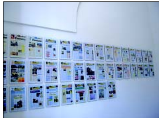
Sopra, nella foto, i cinque anni della legislatura attraverso il nostro periodico.