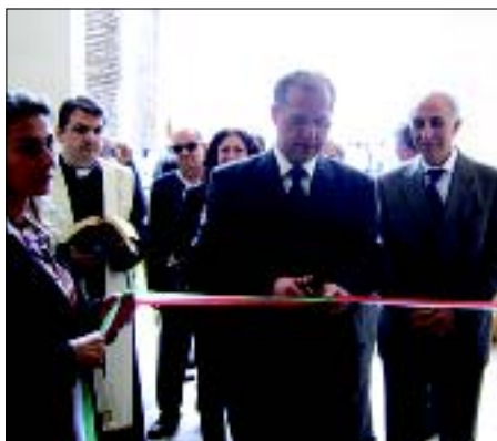
Inaugurazione Urp - Il Sindaco taglia il nastro dell'ufficio