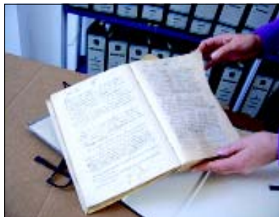
A destra nella foto un registro comunale datato 1809 che attesta la storia della nostra città.

vrà restare in via Falces o se dovrà essere separato dal deposito e dall'archivio corrente per essere portato al castello.