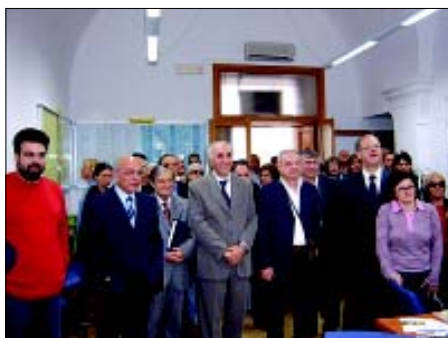
L'interno dell'Urp durante la cerimonia di inaugurazione